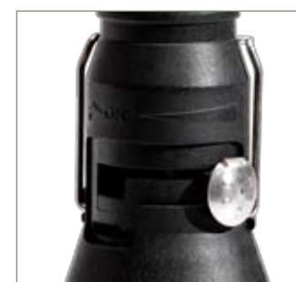
Regolatore di potenza Regulador de potencia Power switch