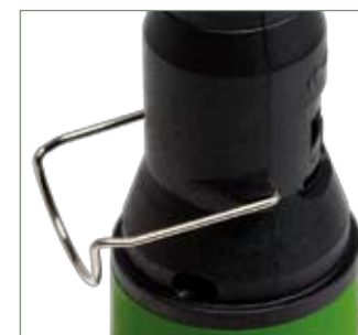
Supporto per appoggio orizzontale Soporte por apoyo horizontal Horizontal stand-by support