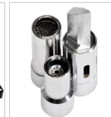
Accessori inclusi Accesorios incluidos Included accessories