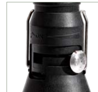
Regolatore di potenza Regulador de potencia Power switch