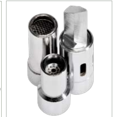
Accessori inclusi Accesorios incluidos Included accessories