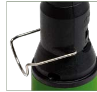
Supporto per appoggio orizzontale Soporte por apoyo horizontal Horizontal stand-by support