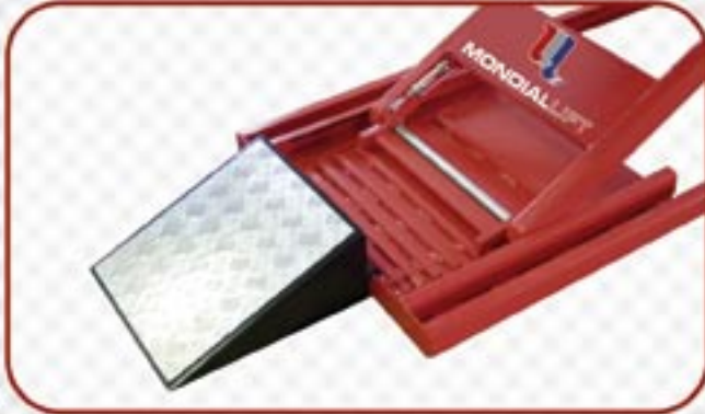
SEGURIDAD MECÁNICA A CREMALLERA