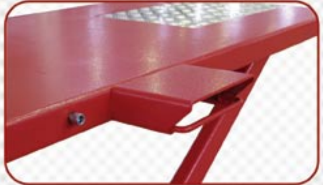
DOBLE POSICIÓN DE APOYO PARA CABALLETE LATERAL