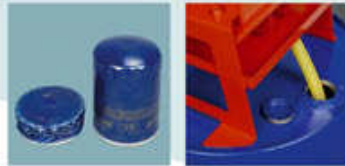
Optima, fácil y limpia recuperación del aceite usado.

Reducir el tamaño de los filtros usados genera un ahorro importante de espacio en su taller y de dinero en sus gastos de gestión de contenedores para reciclado.