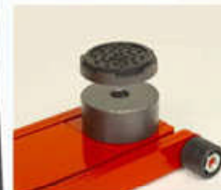
A-5182 Prolongador de 50 mm. Opcional