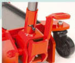
Pedal de aproximación rápida a la carga (excepto en el TJE-2).

El asa ergonómica con empuñadura de goma permite el manejo desde cualquier posición.