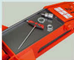
Bandeja portaobjetos (modelos T).