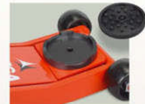
A-5181 Protección de goma. Opcional