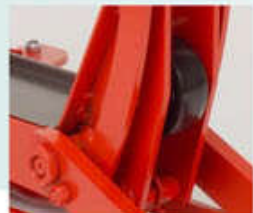
La rueda interior en los modelos T2X y T1.5H facilita una excelente maniobrabilidad.