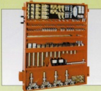
A00504 Armadio / Jig holding cabinet / Armario porta plantillas de pared.

Salita senza l'ausilio delle pedane laterali. Con auto sopra el banco no se necesitan rampas laterales. To put the car on the bench, lateral ramps are not required.